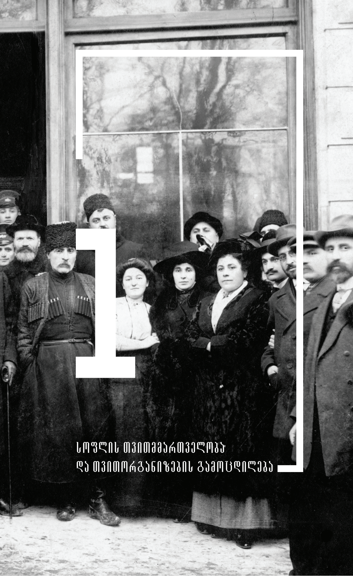
სოფლის თვითმმართველობა და თვითორგანიზების გამოცდილება